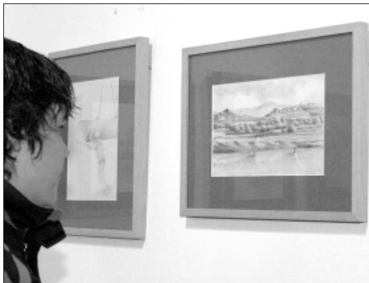
La exposición incluye varios dibujos de las obras. MARIA JOSÉ SANTOLARIA

El destino de 'Camino al agua' va a ser, en principio, el Ayuntamiento de Huesca y, una vez construido el segundo pabellón del CDAN, se colocará allí.