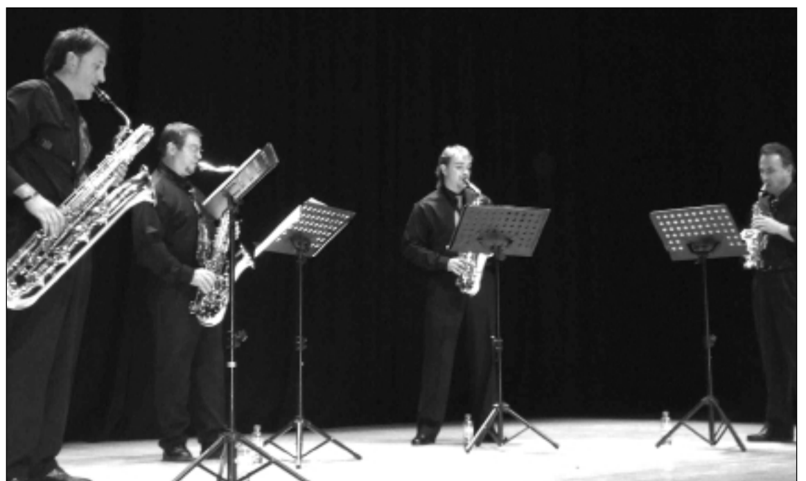
El Cuarteto de Saxofones "Ciudad de Sabiñánigo" durante su concierto en el Auditorio La Colina. M.P.

El concierto llevaba por título "El saxofón desde Europa hasta América" y en él, los componentes del Cuarteto hicieron un recorrido por la música de este instrumento. En la primera parte del recital interpretaron piezas escritas en Europa para otros instrumentos que no el saxofón, como el Concierto de Brandenburgo de Bach o el Allegro & Hornpipe de Handel. Después, musicalmente hablando, dieron un salto a América recorriendo todo tipo de ritmos como el chachachá, la samba, el vals, el rags time y el dixie, y terminaron con el jazz, tal vez, el ritmo con el que